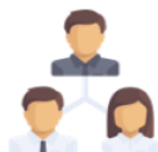
3. Sensibilisation des occupants

Ces défis pourront être menés « seuls » ou en lien avec une association locale ou une démarche particulière (la Semaine Européenne de la Réduction des Déchets par exemple).