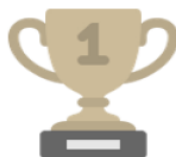
4. Challenges d'économie d'énergie